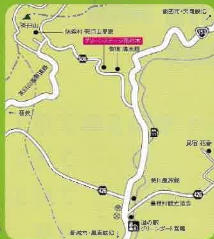
グリーンステージ花の木農園MAP