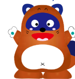
豊根村キャラクター ボンタ

天然記念物ハナノキ自生地の森で 川遊びや森林浴を満喫しませんか 魚(ニジマス)や道具をそろえて 皆様のお越しをお待ちしております