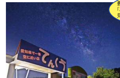
星空カフェ「てんくう」

星空案内人の楽しい解説を聞きながら、美しい星空を楽しみましょう。季節ごとの星座や 惑星を望遠鏡で観察します。※雨天でも開催。星空案内人の楽しいお話が聞けます。 ※日帰りの方は第4駐車場をご利用ください。