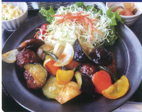
チョウザメだんごの香酢定食 ☀️