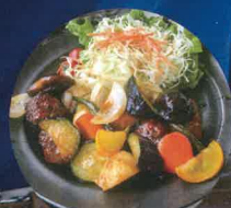
チョウザメ団子の香酢定食