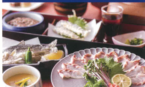
奥三河と信州の楽膳 (豊根村産チョウザメの薄造り) ☀️