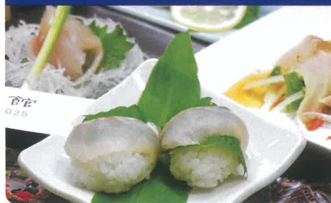
ロイヤルフィッシュおまかせコース ☀️🌙