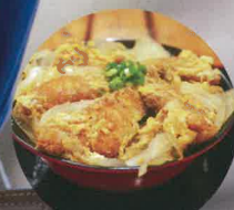
チョウザメかつ丼