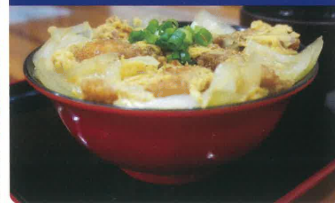
ロイヤルフィッシュカツ丼 ☀️ ロイヤルフィッシュフルコース 🌙