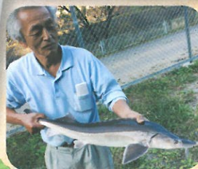
(とよねチョウザメ)