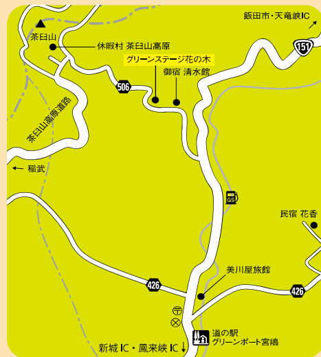
グリーンステージ花の木周辺MAP