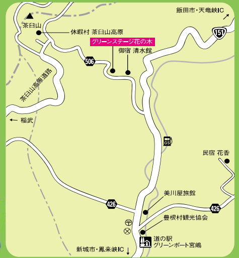
グリーンステージ花の木周辺MAP

お問い合わせ先: グリーンステージ花の木管理組合 TEL: 0536-87-2203 ○受付時間: 9:00 ~ 16:00 FAX: 0536-87-2210 ○定休日: 木曜日