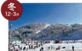
茶臼山高原スキー場