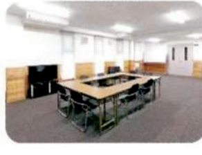
2F展示室 (多目的スペース)