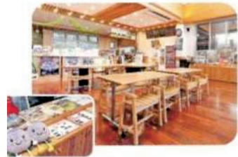
観光情報 コーナー