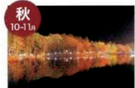
紅葉ライトアップ