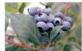
ブルーベリー摘み取り(7-8月)