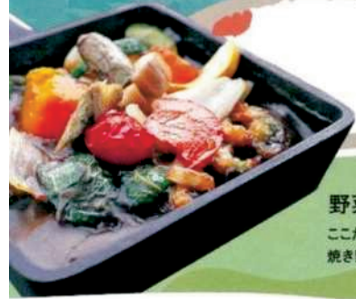
野菜ゴロゴロカレー ここだけのオリジナルカレーです 焼き野菜たっぷり元気もりもり