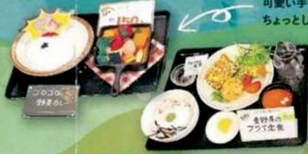
クラフトメニュー 可愛い手作りメニューサンプル ちょっとした話題になりました!