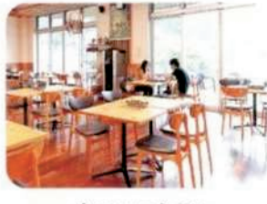
山のレストラン ふるさと

いきいきとれたて産直野菜や 地元などの特産品がずらり ご自宅に、お土産に、ぜひどうぞ。