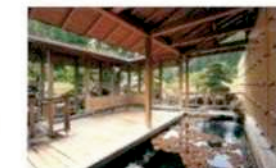
湯へらんどバルとよね