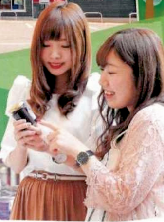
地元産のお土産 特産品のブルーベリーを 使用したジャムなどが人気